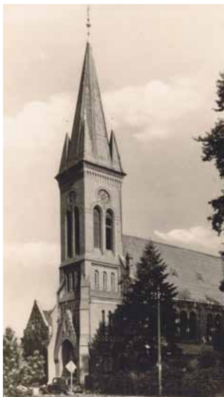
Christuskirche (historische Aufnahme)

Anmeldungen, Informationen und Hinweise: im Gemeindebüro (Tel. 04101-2 22 57) oder bei Pastor Reichenbacher (Tel. 04101-20 81 86)