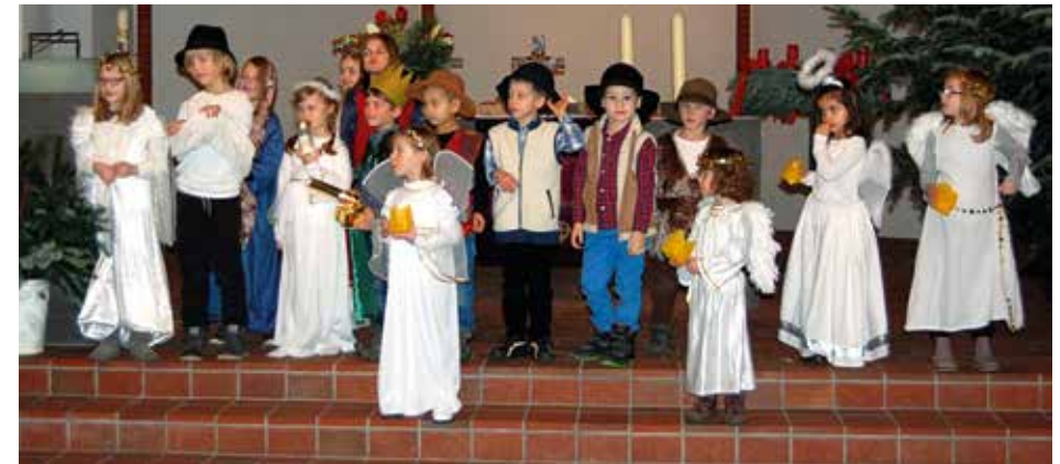
Das Krippenspiel im vergangenen Jahr hat allen viel Spaß gemacht.